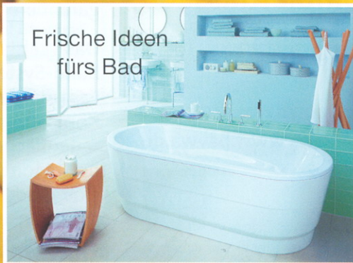
Frische Ideen fürs Bad