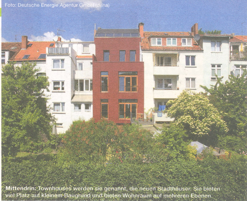
Mittendrin: Townhouses werden sie genannt, die neuen Stadthäuser. Sie bieten viel Platz auf kleinem Baugrund und bieten Wohnraum auf mehreren Ebenen.

Viel Platz auf wenig Baugrund bieten auch die sogenannten Townhouses, die neue Form des altbekannten Reihenhauses. Es will hoch hinaus, erstreckt sich nicht selten über mehr als drei Stockwerke, gern auch – der großzügigen Wirkung zuliebe – verteilt auf mehreren Ebenen in offenen Halbgeschossen. Der individuelle Gestaltungsspielraum ist dabei – auch auf relativ kleinen Grundstücksparzellen – deutlich höher als beim Geschosswohnungsbau. Der Nachfolger des Reihenhauses steht vorzugsweise mitten in der Stadt.